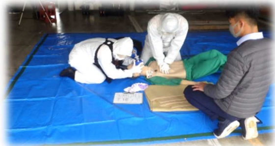
新型コロナウイルスに対応した救急訓練