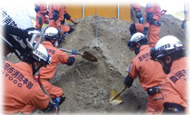
土砂災害対応訓練