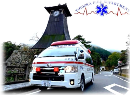
新出石救急車 (のぞみ)